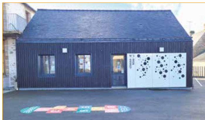
3 ème salle de classe

Avec le conseil des enfants, le projet de terrain multisports avance bien. Il devrait voir le jour en 2023 à l'entrée du bourg, juste derrière la petite chapelle.