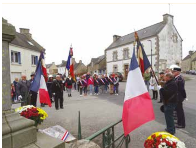
Cérémonie du 11 Novembre 2022