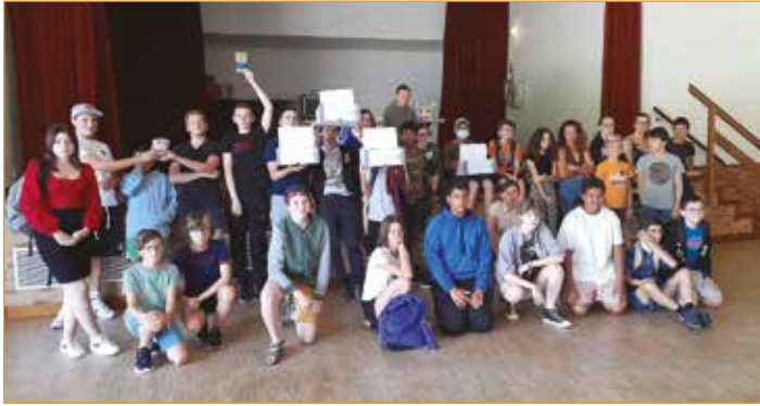
Grand Jeu Inter