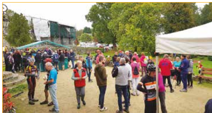
Randonnée de Chapelain