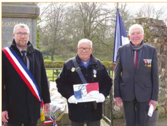
Cérémonie du 19 Mars 2022