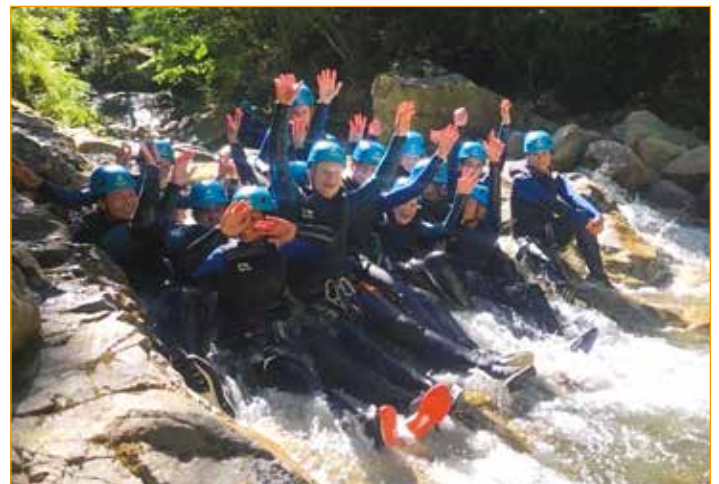
Séjour Espagne 2022