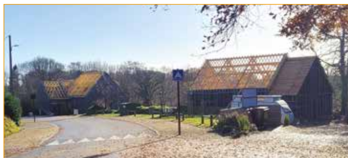
Lotissement du Colzen