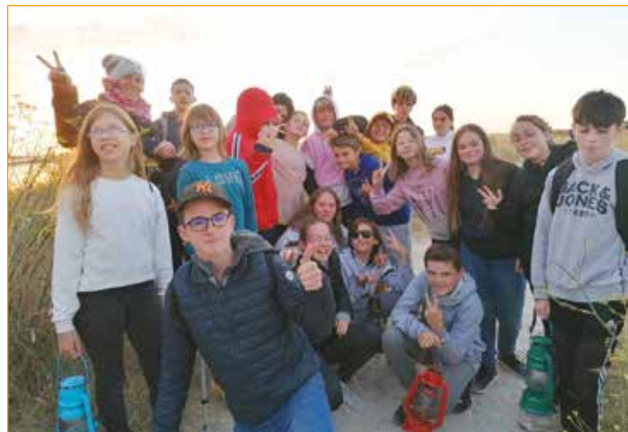
Aventure aux Sommets

Un programme bimestriel des activités pour les mercredis, samedis et vacances scolaires est diffusé dans les collèges